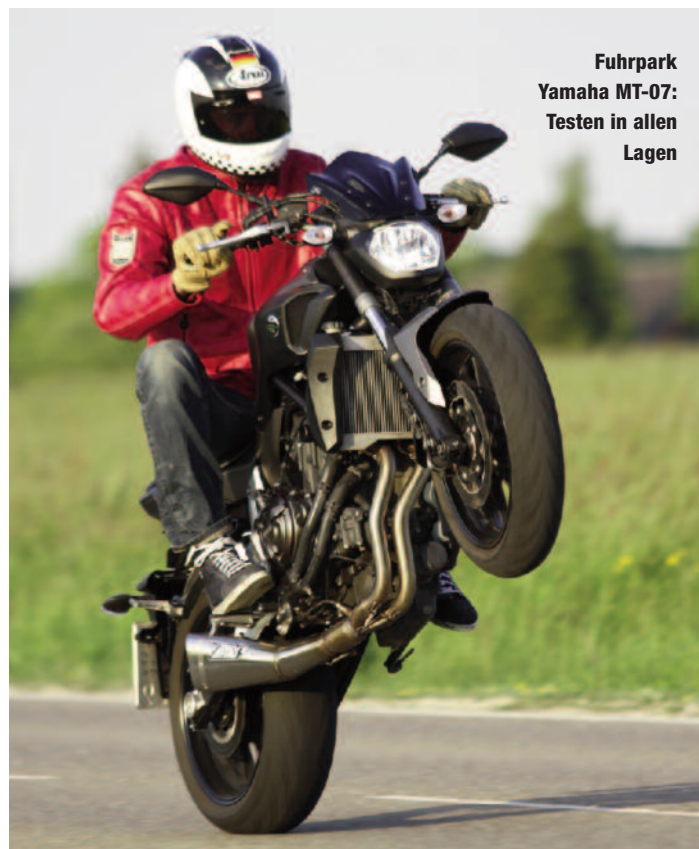
Fuhrpark Yamaha MT-07: Testen in allen Lagen